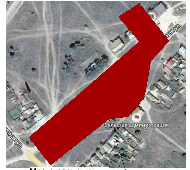
Место размещения проектируемого участка