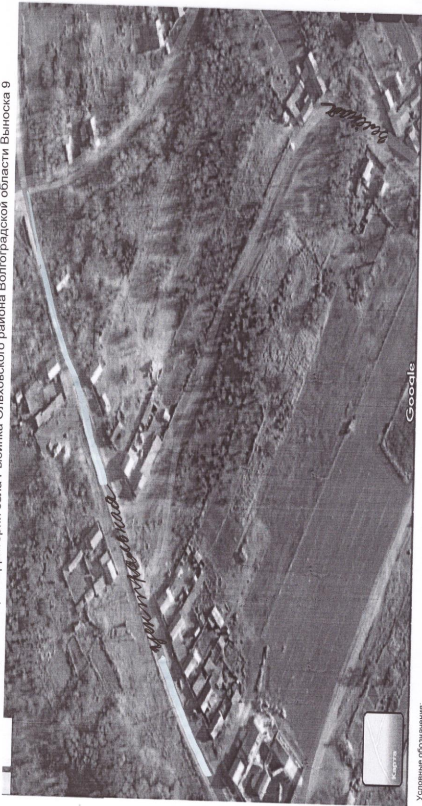
Схема прилегающих территорий села Рыбинка Ольховского района Волгоградской области Выноски 9

Условные обозначения: Спутниковая картографическая основа Границы кадастрового квартала Границы и площадь прилегающей территории Адрес 8 Кадастровые границы земельных участков