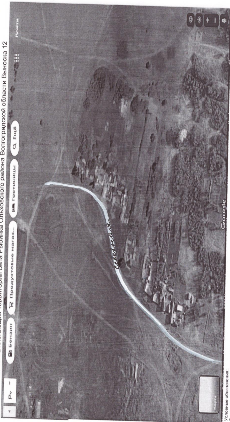
Схема прилегающих территорий села Рыбинка Ольховского района Волгоградской области Выноски 12

Условные обозначения: Спутниковая картографическая основа Границы кадастрового квартала Границы и площадь прилегающей территории Адрес 8 Кадастровые границы земельных участков