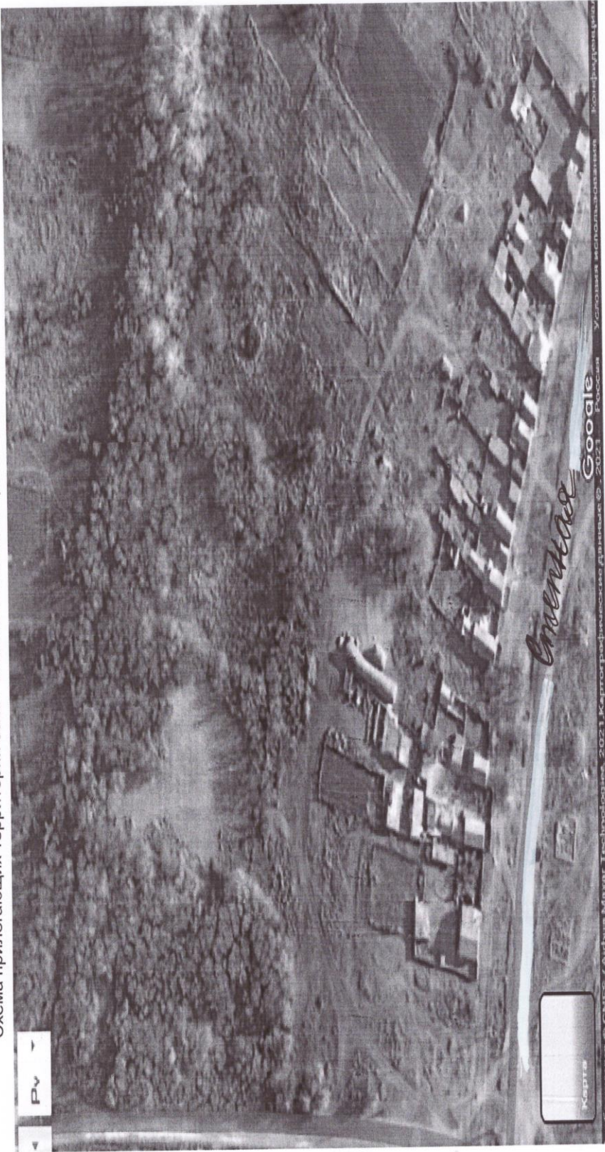
Схема прилегающих территорий села Рыбинка Ольховского района Волгоградской области Выноска 8

Масштаб 1:1 000 Утверждена: Решением сельского Совета депутатов Рыбинского сельского поселения Ольховского муниципального района Волгоградской области от 26.04.2021 № 5/А