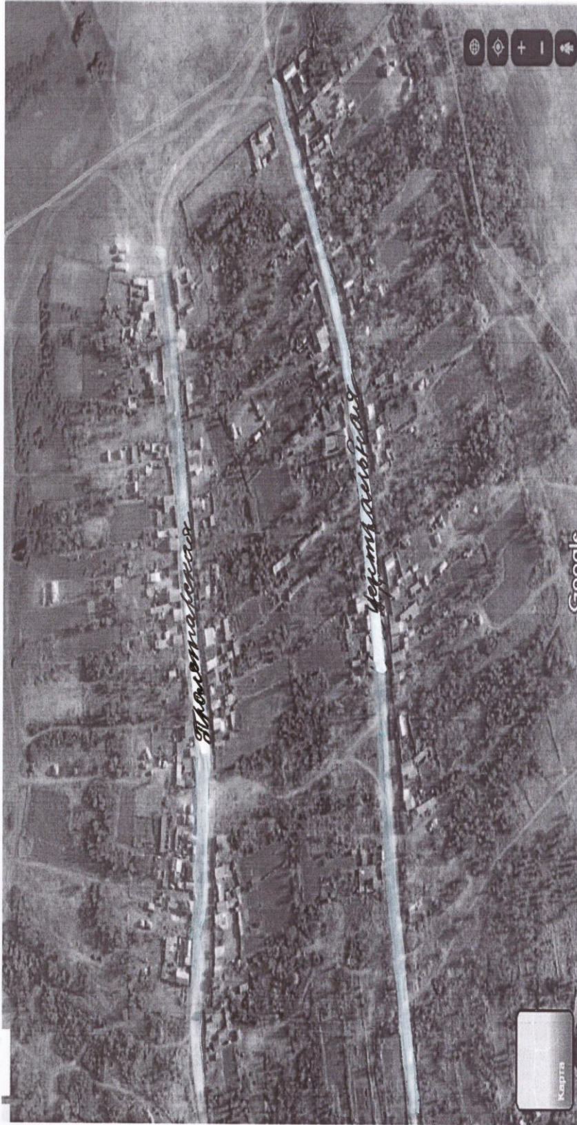
Схема прилегающих территорий села Рыбинка Ольховского района Волгоградской области Выноска 11