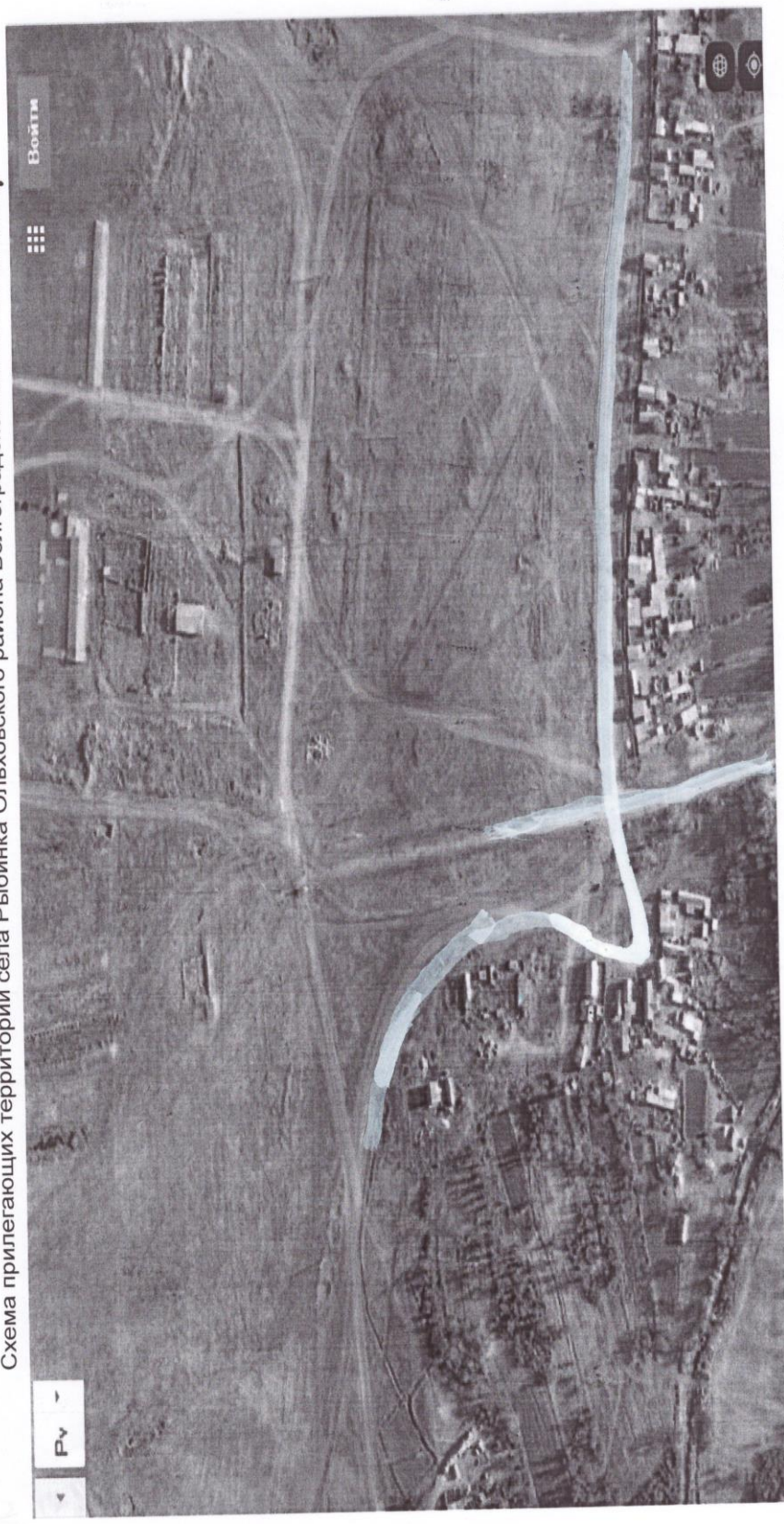
Схема прилегающих территорий села Рыбинка Ольховского района Волгоградской области Выноска 4

Условные обозначения: Спутниковая картографическая основа Границы кадастрового квартала Границы и площадь прилегающей территории Адрес 8 Кадастровые границы земельных участков