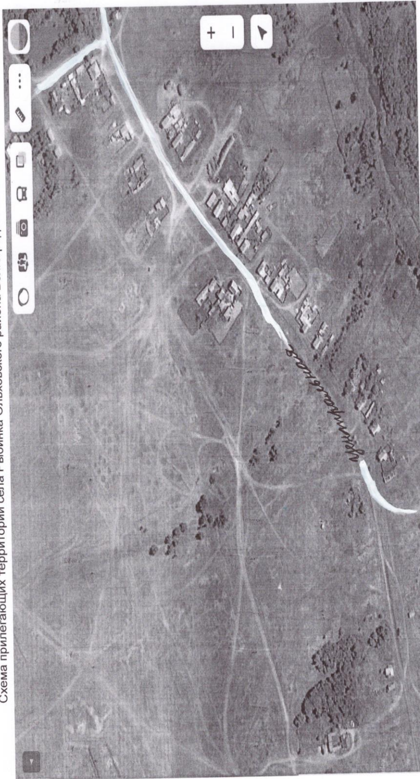
Схема прилегающих территорий села Рыбинка Ольховского района Волгоградской области Выноски 3

Масштаб 1:1 000 Утверждена: Решением сельского Совета депутатов Рыбинского сельского поселения Ольховского муниципального района Волгоградской области от 26.04.2021 № 3/2