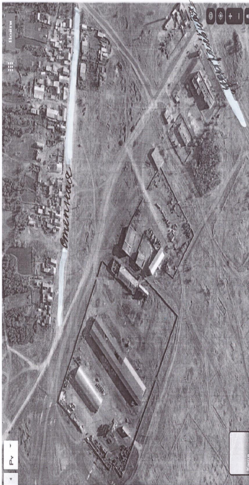
Схема прилегающих территорий села Рыбинка Ольховского района Волгоградской области Выноски 5