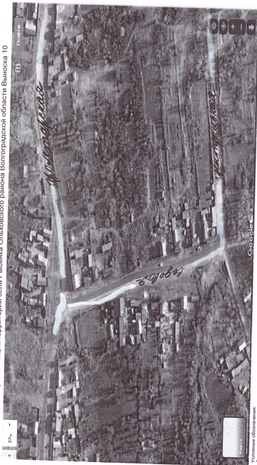
Схема прилегающих территорий села Рыбинка Ольховского района Волгоградской области Выноска 10

Масштаб 1:1 000 Утверждена: Решением сельского Совета депутатов Рыбинского сельского поселения Ольховского муниципального района Волгоградской области