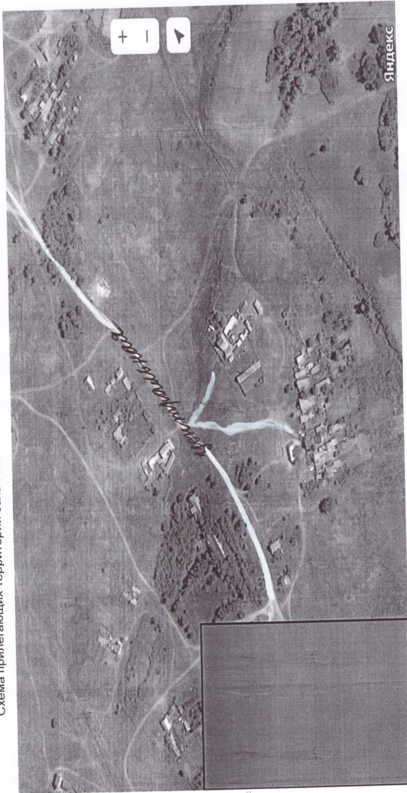
Схема прилегающих территорий села Рыбинка Ольховского района Волгоградской области Выноска 4

Условные обозначения: Спутниковая картографическая основа Границы кадастрового квартала Границы и площадь прилегающей территории Адрес 8 Кадастровые границы земельных участков